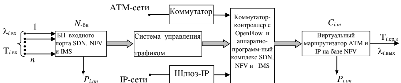
Рис. 1. Структурно-функциональная схема и модели процессов мультисервисных сетей

Где, f(H_i) – функция, учитывающая свойство мультифрактальности поступающих трафиков и равна f(H_i) = 2H_i ; H_i – коэффициент Хэрста для самоподобного трафика потока i -го пакета, i = \overline{1, n} ; \lambda_i и \mu_i – скорость обслуживания самоподобных потоков i -го пакета, i = \overline{1, n} .