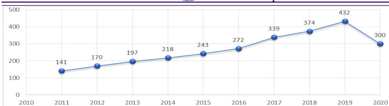
Qrafik 3. COVID-19 pandemiyasının Azərbaycanda fəaliyyət göstərən səyahət agentlikləri və tur operatorların sayına təsiri, ədədlə

(Azərbaycan Respublikasının Dövlət Statistika Komitəsinin məlumatları əsasında müəllif tərəfindən tərtib edilmişdir)