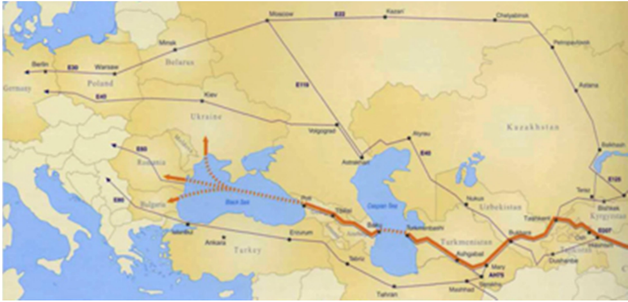
Şək. 1. “Böyük İpək yolu”nun fəaliyyətində Azərbaycan amili

Ulu öndərimiz Heydər Əliyev həmin dövrdə nəqliyyat-kommunikasiya sahəsində TRASEKA layihəsinin əhəmiyyətini ilk vaxtlardan görərək, ölkəmizin bu layihədə iştirak etməsinə böyük əhəmiyyət vermişdir.