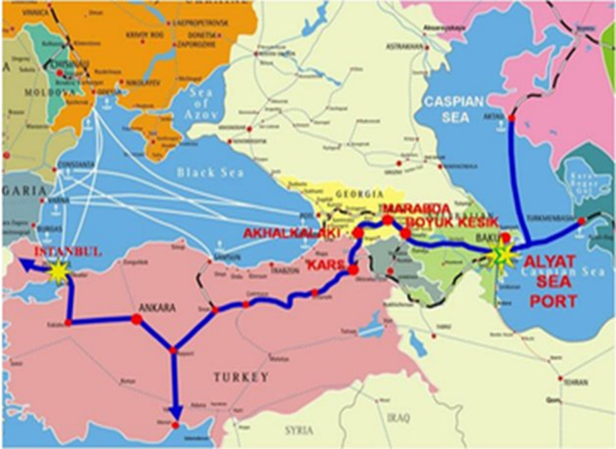
Şək. 2. Beynəlxalq və regional nəqliyyat dəhlizlərinin reallaşmasında Azərbaycanın əhəmiyyəti

Heydər Əliyevin bilavasitə həyata keçirdiyi beynəlxalq nəqliyyat dəhlizləri siyasəti sahəsində əldə edilmiş ən böyük uğurlardan biri də Bakı-Tbilisi-Qars (BTQ) dəmir yolu layihəsi idi. Bu layihə mühüm əhəmiyyətə malik olmaqla bərabər, XXI əsrdə Asiya ilə Avropanı birləşdirən ən mühüm nəqliyyat dəhlizinə çevrilir və bölgədə təhlükəsizliyin və sabitliyin artırılmasına xidmət edir [2].