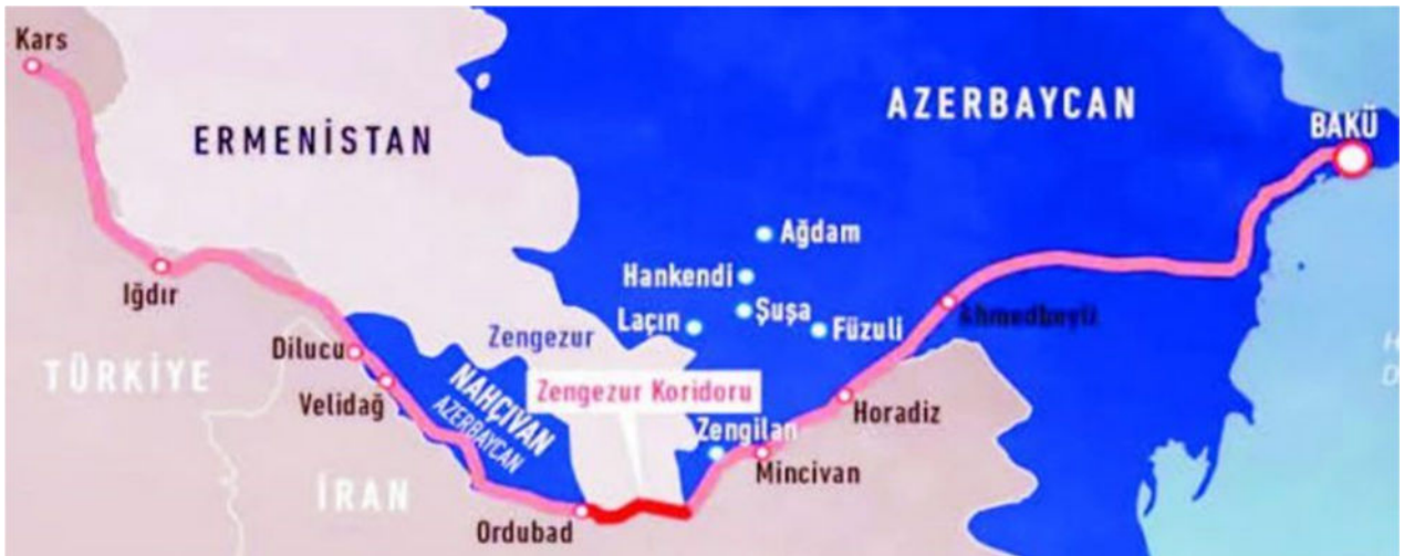
Şək. 4. Zəngəzur dəhlizinin sxematik təsviri

Heydər Əliyevin Naxçıvan Muxtar Respublikasının blokadasının sona çatdırılması arzusu, Prezidentimiz İlham Əliyev tərəfindən, açılması israrla tələb olunan Zəngəzur dəhlizinin reallaşması nəticəsində yaxın zamanlarda mümkün olacaqdır (şək. 3).